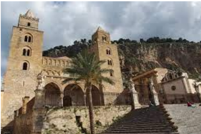
Duomo di Cefalù

Partenza da Catanzaro, arrivo a Cefalù e visita con guida: Duomo, Corso Vittorio Emanuele - lavatoio, salita saraceni, tempio di Diana, patrimonio dell'UNESCO. Pranzo libero. Nel pomeriggio tardo: partenza per Palermo con sistemazione in hotel. Cena e pernottamento.