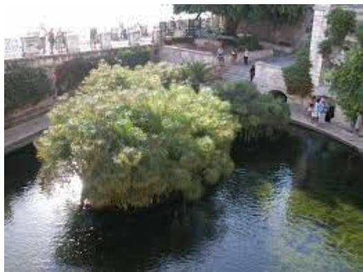
Siracusa, Fonte Aretusa