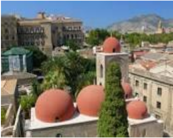
San Giovanni degli Eremiti