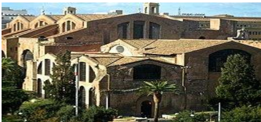
Terme di Diocleziano

Prima colazione in Hotel , carico dei bagagli sul bus e Partenza per Roma . Visita guidata del Museo delle Terme di Diocleziano e di Palazzo Massimo. Pranzo libero. Nel pomeriggio visita guidata dei Musei Capitolini. Al termine trasferimento in hotel, HOTEL QUALITY GREEN PALACE 4* ZONA MONTEROTONDO . Cena e pernottamento.