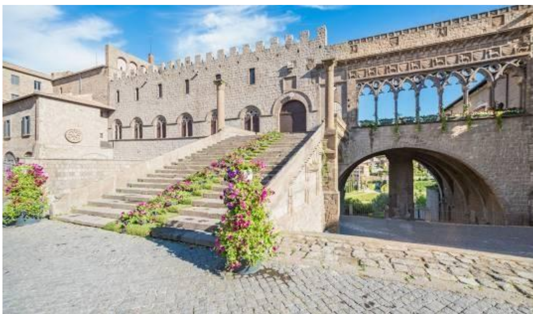
Viterbo, Palazzo dei Papi

OGGETTO: Avviso viaggio istruzione_Terze_ classi Etruria e dintorni