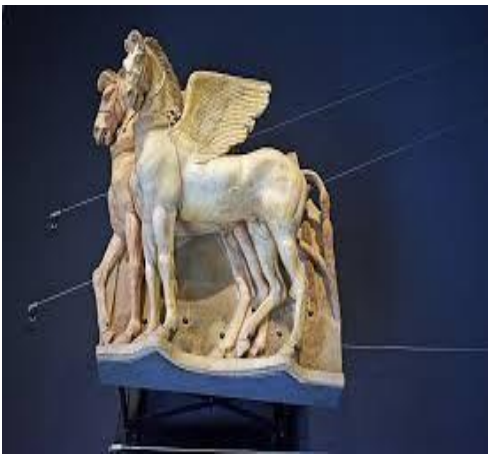
Museo di Tarquinia, Cavalli alati

In questa sezione si trova il pezzo più famoso di tutto il museo, un'opera unica al mondo, l'altorilievo dei Cavalli Alati Risalente al IV sec. a.c., provenienti dall'Ara della Regina ed inoltre da poco più di due anni è esposto il gruppo scultoreo raffigurante il dio Mitra risalente al II sec. d.c., un'importante testimonianza del periodo romano a Tarquinia.